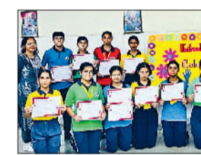
चरखी दादरी। अंतरसदनीय क्लब गतिविधियों में भाग लेते बच्चे।

आरईडी स्कूल, चरखी में तीसरी से दसवीं के विद्यार्थियों के लिए अंतरसदनीय क्लब गतिविधियों का आयोजन किया गया। इसमें विद्यालय के चारों सदनों गांधी, रमन, सुभाष व टैगोर के प्रतिभागियों ने बहद-चढ़कर भाग लिया। इस शैक्षणिक प्रतियोगिता का मुख्य उद्देश्य छात्रों में विभिन्न शैक्षणिक व प्रायोगिक कौशलों विकास करना था। ये गतिविधियाँ लिटरेरी, साइंटिफिक, सोशल एंड एनवायरमेंट, योग और संगीत व कला क्लबों के द्वारा आयोजित की गईं। इनमें हिंदी और अंग्रेजी की