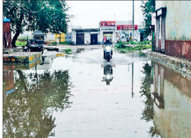
भिवानी। ग्रामीण इलाके में जमा बारिश के पानी को फिर कर निकालना दोपहिया वाहन याचक।

शुक्रवार सुबह जब लोग सोकर उठे तो उस वक्त सूर्य देव की तपिश चहुआर पहुंच रही थी। उसके बाद धीरे धीरे दिन चढ़ना शुरू हुआ। उसी