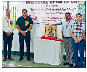
बहल | मेजर ध्यानचंद के चित्र पर पुष्प अर्पित करते हुए।