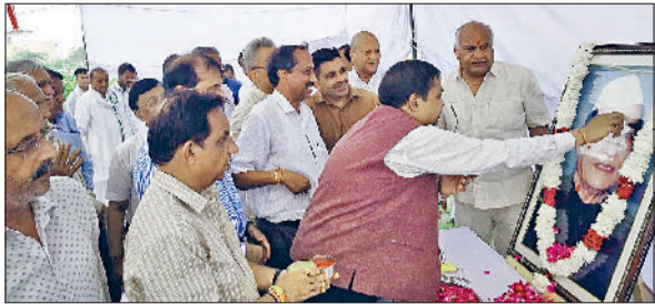
मिवानी | पूर्व सीएम बीडी गुप्ता की पुण्यतिथि पर महाविद्यालय की राष्ट्रीय सेवा योजना द्वारा आयोजित कार्यक्रम में पौधा देकर सम्मानित करते हुए व बीडी गुप्ता पार्क में पूर्व सीएम स्व.बीडी गुप्ता के चित्र पर पुष्प अर्पित करते हुए।