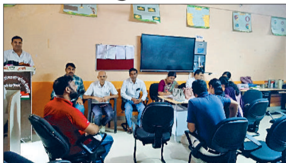
बवानीखेड़ा। खंड स्तरीय प्रतियोगिता में निर्णायक मंडल की टीम के साथ अधिकारी।