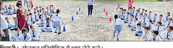
मिवानी | खेलकूद प्रतियोगिता में भाग लेते बच्चे।

मिवानी। आसलवास दुबिया स्थित सरस्वती विद्या विहार सीनियर सेकेंडरी स्कूल में बड़े हर्षोल्लास के साथ राष्ट्रीय खेल दिवस मनाया गया। इस अवसर पर विद्यालय में विभिन्न खेल प्रतियोगिताओं का आयोजन किया गया। विद्यार्थियों ने दौड़, कबड्डी, वॉलीबॉल, खो-खो, रस्साकशी तथा अन्य खेलों में शानदार प्रदर्शन किया। प्रतियोगिताएँ हाउस वाइज आयोजित की गईं, जिससे विद्यार्थियों में टीम भावना और खेल के प्रति जोश और जागरूकता का