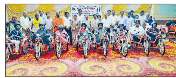
भिवानी। दिव्यांगजनों को मोटराइज्ड ट्राइसाइकिल भेंट करते अतिथि।