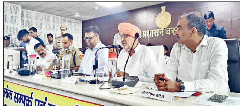
चरखी दादरी। जिला लोक संपर्क एवं परिवेदना समिति की बैठक में समस्या सुनते मंत्री।