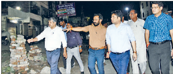
भिवानी। रात को सफाई का निरीक्षण करते उपयुक्त।