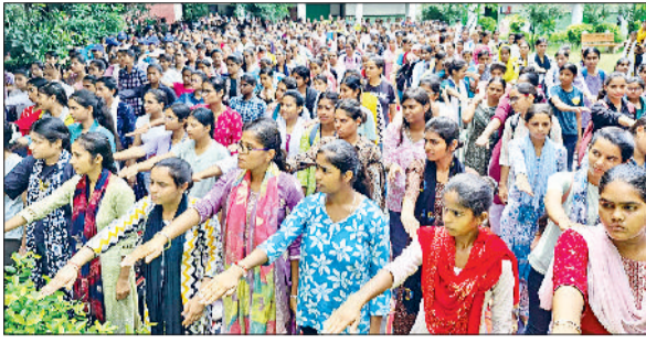
भिवानी। छात्राओं को स्वच्छता की शपथ दिलाते हुए। कॉलेज परिसर में सफाई अभियान चलाते हुए।