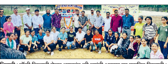
मिवानी | हॉकी खिलाड़ी मेजर ध्यानचंद की जयंती अवसर पर एकत्रित खिलाड़ी।