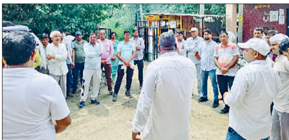
भिवानी। मांगों को लेकर एकत्रित कर्मचारियों को संबोधित करता एक वक्ता।