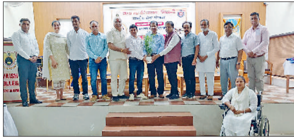
मिवानी | पूर्व सीएम बीडी गुप्ता की पुण्यतिथि पर महाविद्यालय की राष्ट्रीय सेवा योजना द्वारा आयोजित कार्यक्रम में पौधा देकर सम्मानित करते हुए व बीडी गुप्ता पार्क में पूर्व सीएम स्व.बीडी गुप्ता के चित्र पर पुष्प अर्पित करते हुए।