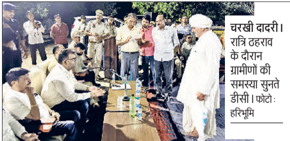
चरखी दादरी। रात्रि ठहराव के दौरान ग्रामीणों की समस्या सुनते डी.सी।